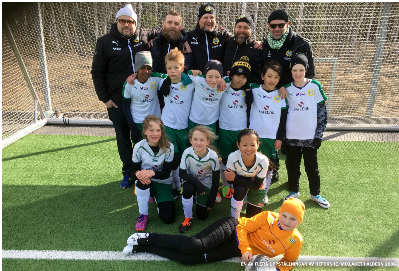
EN AV FLERA UPPSTÄLLNINGAR AV HEFORSHE/MIXLAGET I ÅLDERN 2006

34 lag, 556 spelare och 143 ledare... trånga träningsytor, men finns det hjärterum så finns det plats för klacksparkar!