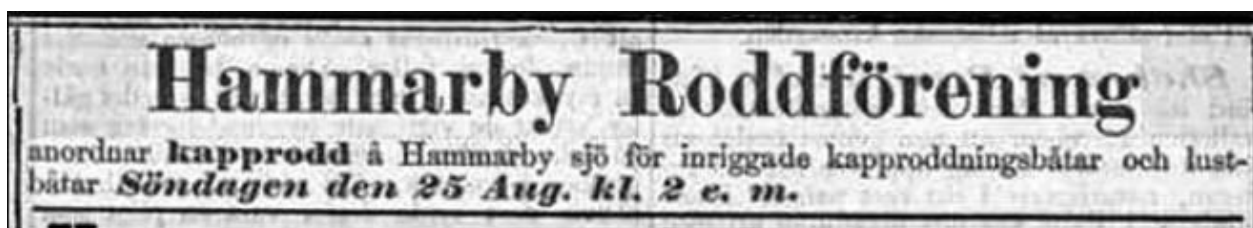
Annons inför Hammarbys regatta den 25 augusti 1889.

Familjeläktaren, sektion 330 gabriel.gemmel@gmail.com